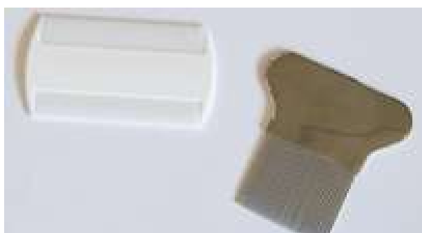
luizen- of stofkam (links) en neten- of nisskakam (rechts)